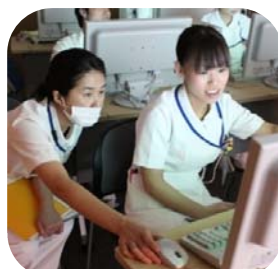
電子カルテ操作研修