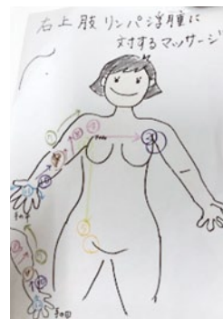
ドレナージ パンフレット

注)リンパ浮腫外来は、当院で鼠径部、骨盤部若しくは腋窩部のリンパ節郭清を伴う悪性腫瘍に対する手術をうけた通院中の患者さんのみを対象としています。